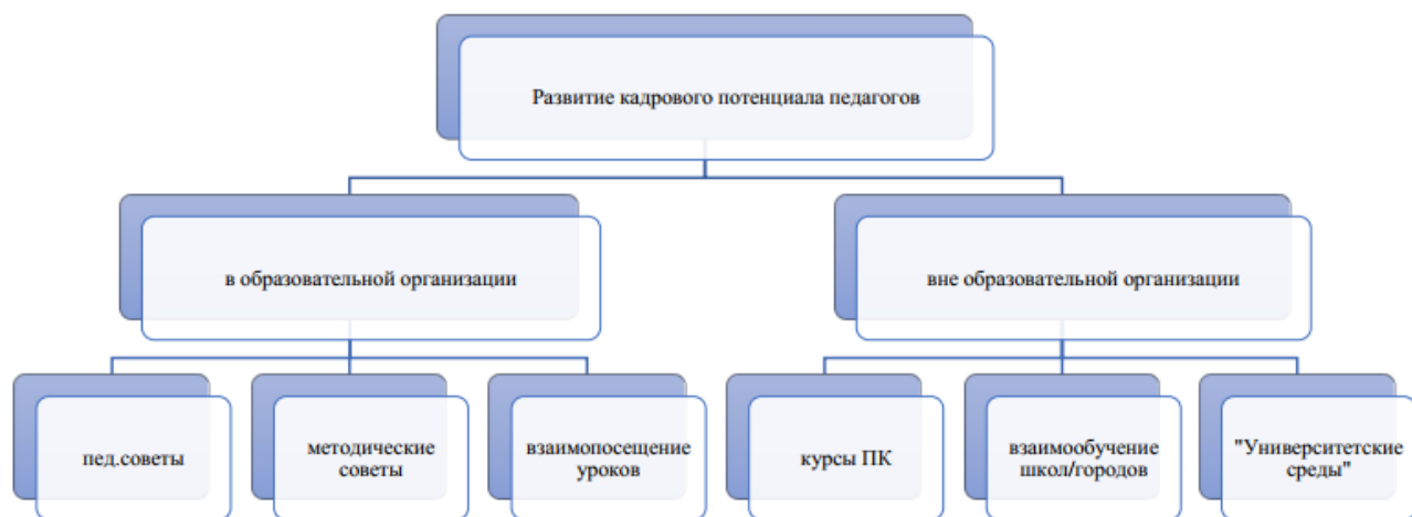
Схема. Развитие кадрового потенциала педагогов МАОУ «СШ № 35»

Основным условием формирования и наращивания необходимого и достаточного кадрового потенциала школы является обеспечение в соответствии с новыми образовательными реалиями и задачами адекватности системы непрерывного педагогического образования происходящим изменениям в системе образования в целом.